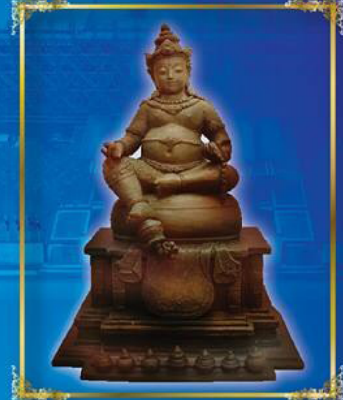
เจ้าพ่อโรงต้ม พระธนบดีมหาเศรษฐี (แบบจำลอง)

นี้เอง ในโอกาสจัดสร้างรูปหล่อเจ้าพ่อโรงต้ม พร้อมถวายภัตตาหารเพล ณ กรมสรรพสามิต